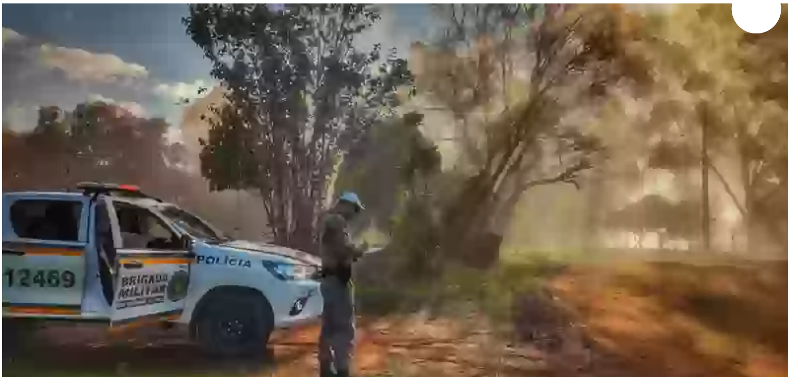
Em Lomba Grande: georreferenciamento facilita localização de propriedade pela BM

Aos poucos, Lomba Grande vai ficando mais nítida no mapa da segurança pública da região. Está progredindo o projeto de georreferenciamento da Brigada Militar, cujo objetivo é anotar as referências de GPS das diferentes propriedades rurais. Com isso, vai ficar mais fácil o atendimento nos locais quando houver necessidade.